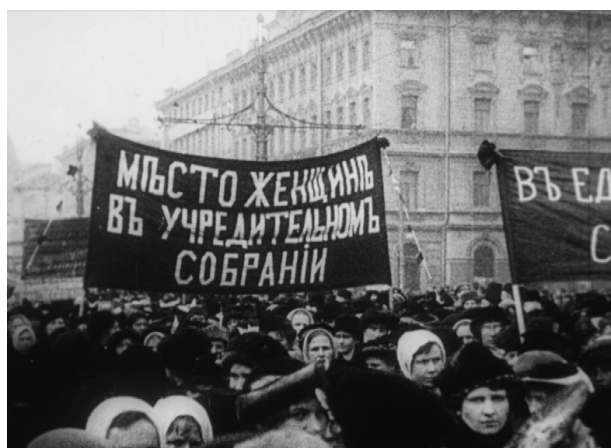
Manifestation de femmes sur la perspective Nevski, mars 1917.

Extraits de films d'époque provenant des Archives russes d'Etat des documents cinématographiques et photographiques (RGAKFD) et acquis récemment par la BDIC. D'une valeur inestimable, ces archives filmiques de la Révolution portent sur les grands événements de l'année 1917 jusqu'à la dissolution de la Constituante par les bolcheviks en janvier 1918.