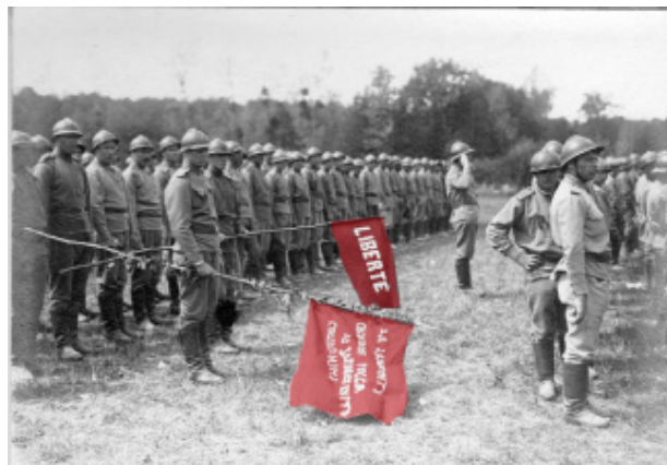
Les mutins de la Courtine, film de Pierre Goetschel, 2015, France 3 Limousin

> Quelque part sur les confins du plateau de Millevaches, dans une des régions les plus dépeuplées de France, se sont jouées - en réduction - les luttes militaires, politiques et sociales qui se produiront en Russie à partir de 1917 jusqu'à la guerre civile un an plus tard.