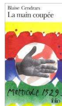
Coll. BDIC – Image VII de Jean Cortot, 1998.

CENDRARS, Blaise La Main coupée , 1946 – Paris : Gallimard, impr. 1974. – 433 p. Collection Folio BDIC – En traitement